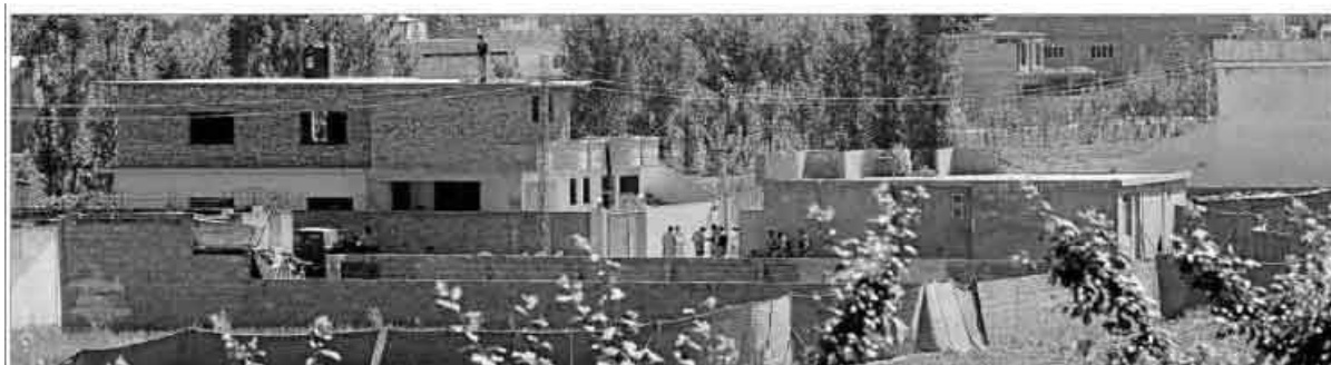
Ilustración 4. Fotografía superior de la portada de El Mundo

otros interrogantes por responder. A nivel de contigüidad, es la imagen más próxima a los hechos, pero esta es la única relevancia que tiene, ya que es una fotografía muy denotativa, no sugiere más de lo que muestra: la fachada exterior de una casa. Al no tener profundidad de campo, no hay más información en la imagen. Si no fuera por el texto del pie de fotografía, nada haría imaginar que dentro de este complejo residencial han podido suceder hechos tan trascendentes para el futuro de nuestra sociedad.