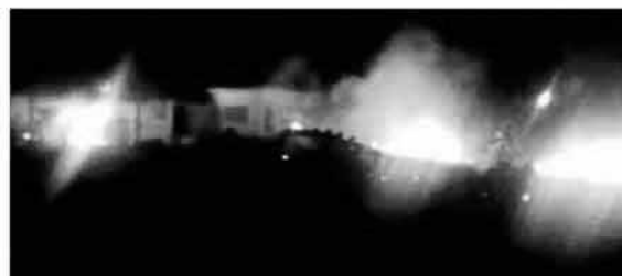
Ilustración 5. Fotografía inferior de la portada de El Mundo

La Vanguardia , considerado un periódico de centro político y monárquico, utilizó como fotografía principal para ilustrar