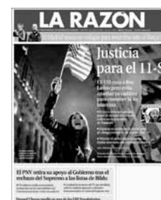
Ilustración 2. Portadas de los seis periódicos analizados